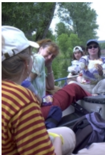
Picknick im Kanu

Die Tagestour in stabilen Canadiern führt uns 17 Flusskilometer die beschauliche fränkische Saale entlang nach Gemünden, wo wir auf dem gut ausgestatteten Campingplatz übernachten. Abends grillen wir gemeinsam und genießen den Abend unter freiem Himmel. Die fränkische Saale ist in diesem Abschnitt auch für ungeübte Paddler/innen bzw. Anfänger/innen unproblematisch zu befahren. Die Tour ist also für alle geeignet, die Lust auf einen erholsamen Tag auf dem Wasser, in schöner Natur und mit netter Gesellschaft haben. Sie bietet sich auch hervorragend als Vorbereitung für unsere Kanutouren in Mecklenburg-Vorpommern an.