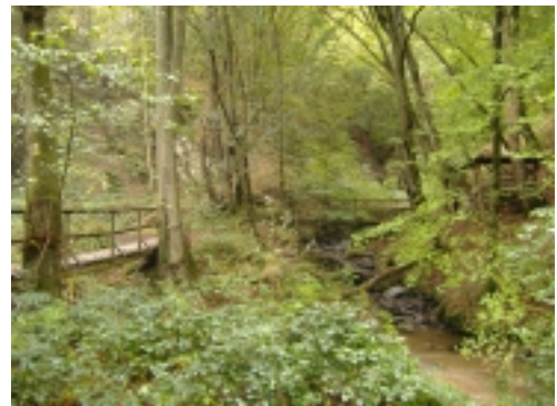
Im idyllischen Baybachtal

Für die Klammwanderung benötigen Sie Wanderfreude bei jedem Wetter , feste Schuhe, Regensachen, Tagesrucksack und Ihren Proviant für die Wanderungen