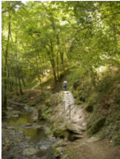
Unser Weg im idyllischen Ehrbachtal